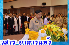
พิธีทำบุญตักบาตรข้าวสาร-อาหารแห้ง และ พิธีลงนามถวายพระพรฯ ณ ศาลากลางจังหวัดสุพรรณบุรี