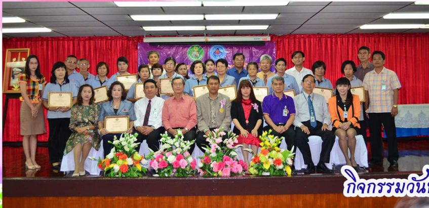
กิจกรรมวันที่ ๑๘ มี.ค.๕๘