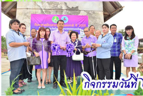
กิจกรรมวันที่ ๒๐ มี.ค.๕๘